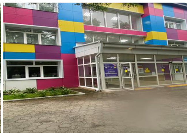
Детская поликлиника, г. Дальнегорск, пр-т 50 лет Октября, 9