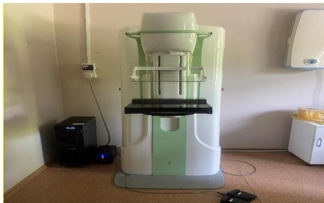
Маммограф рентгеновский «МАММО -4МТ»