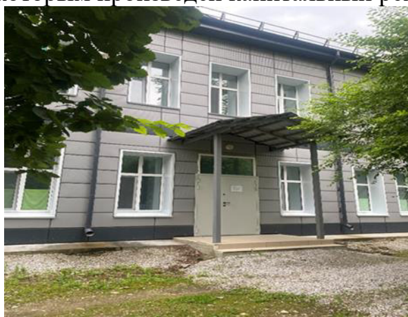
Инфекционное отделение г. Дальнегорск, пр-т 50 лет Октября, 94

Сотрудниками Контрольно-счетной палаты Приморского края проведены осмотр и фотофиксация объектов недвижимости Учреждения, по которым произведен капитальный ремонт.