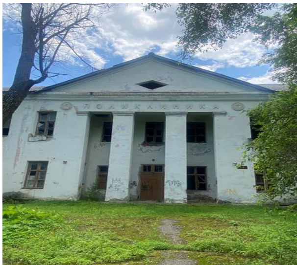
10.07.2024 Центральная поликлиника