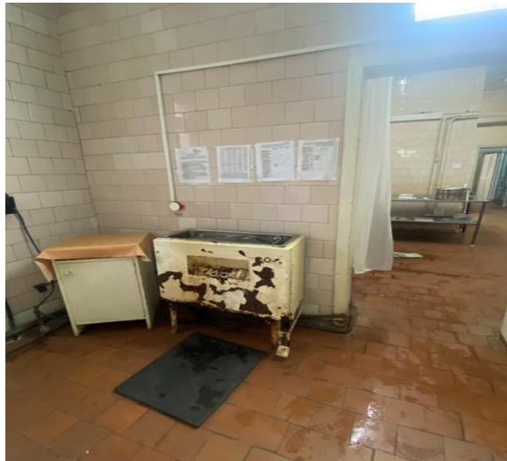
Внутренние помещения, оборудование центрального стерилизационного отдела г. Дальнегорск, пр-т 50 лет Октября, 94

- корпуса центрального стерилизационного отдела и пищеблока находятся в неудовлетворительном состоянии; здание гаража со складскими помещениями, здание патологоанатомического отделения также нуждаются в капитальном ремонте.