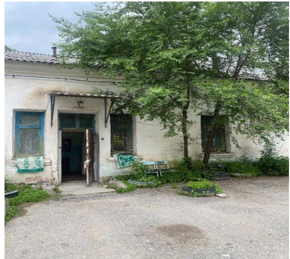
Централизованный стерилизационный отдел г. Дальнегорск, пр-т 50 лет Октября, 94

С 2014 года Учреждение использует аутсорсинг питания, в связи с чем 10 лет здание пищеблока законсервировано (акт о переводе пищеблока на консервацию от 27.02.2014). Согласно акту технического состояния здания пищеблока, сданного в эксплуатацию в 1974/1990 году от 17.01.2014, объект недвижимости нуждался в капитальном ремонте. По состоянию на 02.06.2024 балансовая стоимость объекта недвижимости – 9 360,99 тыс. рублей, сумма начисленной амортизации – 4 157,85 тыс. рублей, остаточная стоимость – 5 203,14 тыс. рублей. Вместе с тем Учреждение несет обязанность по содержанию неиспользуемого имущества, в том числе по уплате имущественного и земельного налога на общую сумму 157,154 тыс. рублей, что в соответствии со статьей 34 Бюджетного кодекса Российской Федерации является неэффективным использованием средств (за 2023 год налог на имущество составил 114,984 тыс. рублей, земельный налог – 42,17 тыс. рублей).