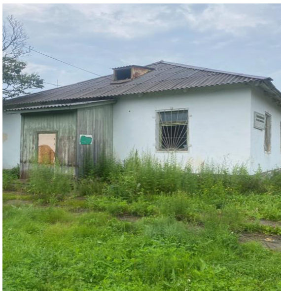
Амбулатория с. Каменка Амбулатория, г. Дальнегорск, ул. Маяковского, 5

В составе особо ценного движимого имущества Учреждения по состоянию на 01.01.2024 числятся 271 единица основных средств общей балансовой стоимостью 596 182,2 тыс. рублей, в результате деятельности Учреждения за 2023 год балансовая стоимость увеличилась на 35 777 тыс. рублей, или на 6 %. Остаточная стоимость особо ценного движимого имущества составила 256 685,8 тыс. рублей и снизилась на 13 329,7 тыс. рублей, или на 4,9 %. Общий износ основных средств на 01.01.2024 составил 339 496,4 тыс. рублей, или 56,9 % от балансовой стоимости.