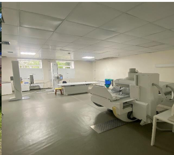
Комплекс рентгеновский диагностический