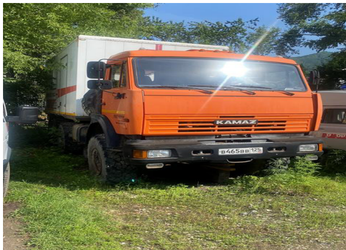
Флюорограф передвижной цифровой ПРОСКАН-7000 на базе КАМАЗ