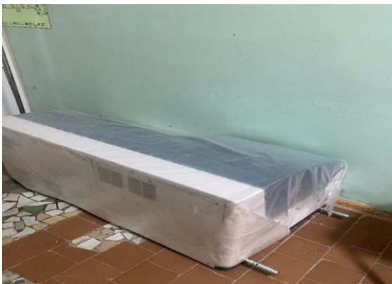
Анализатор иммуноферментный автоматический