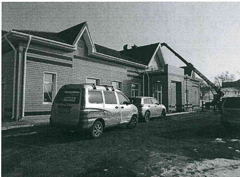
Сельский Дом культуры с. Сергеевка 05.12.2023