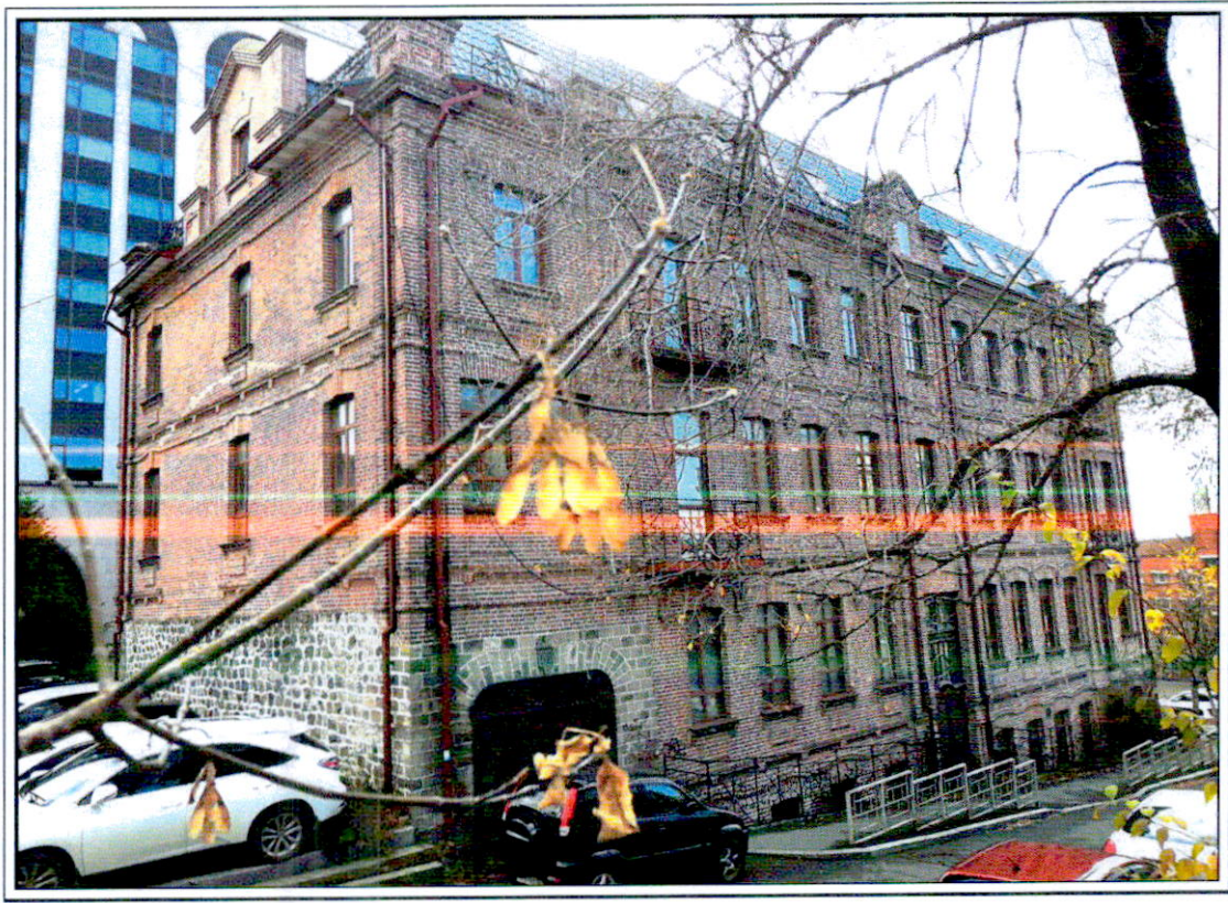
Фотографическое изображение (общий вид) объекта культурного наследия