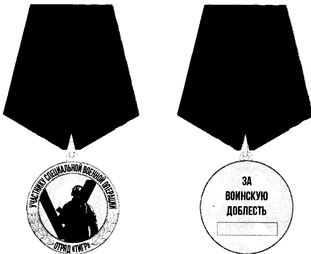
РИСУНОК медали Приморского края "Участнику специальной военной операции. Отряд "Тигр"

«Приложение 6 2 к Закону Приморского края от 04.06.2014 № 436-КЗ