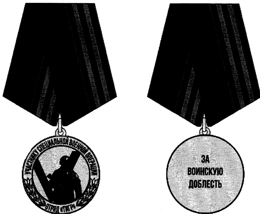
РИСУНОК медали Приморского края "Участнику специальной военной операции. Отряд "Тигр"

«Приложение 6 2 к Закону Приморского края от 04.06.2014 № 436-КЗ