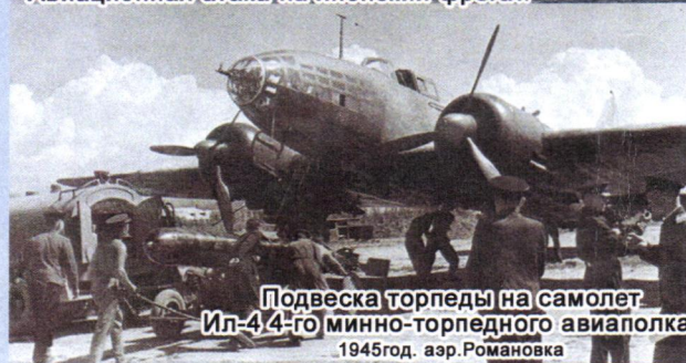
Подвеска торпеды на самолет Ил-4 4-го минно-торпедного авиаполка. 1945 год. аэр. Романовка

134-я отдельная гвардейская дальнеразведывательная авиационная эскадрилья (войсковая часть 62769) является преемницей 50-го СБАП, 50-го МТАП, 50-го ОГРАП и 271-го ОГДРАП).