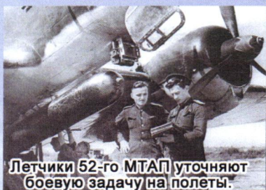
Летчики 52-го МТАП уточняют боевую задачу на полеты. август 1945 года. Романовка.