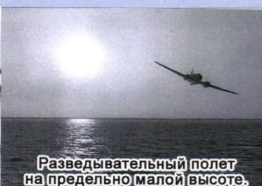
Разведывательный полет на предельно малой высоте.

311 отдельный корабельный штурмовой авиационный полк, сформирован 1 октября 1976 года трехэскадрильным составом, вооруженный самолетами Як-38 и МиГ-21.