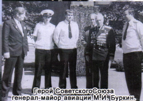
Герой Советского Союза генерал-майор авиации М.И. Буркин. Романовка - Пристань, 1989 года.