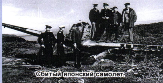
(Сбитый) японский самолет.