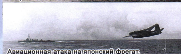
Авиационная атака на японский фрегат.