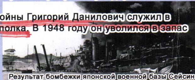
Результат бомбежки японской военной базы Сейсин