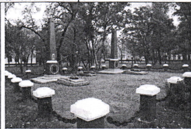
Общий вид мемориального комплекса