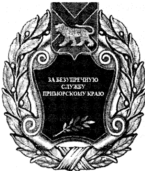
РИСУНОК ЗНАКА ОТЛИЧИЯ ПРИМОРСКОГО КРАЯ «ЗА БЕЗУПРЕЧНУЮ СЛУЖБУ ПРИМОРСКОМУ КРАЮ»

Приложение 10(2) к Закону Приморского края от 04.06.2014 N 436-КЗ