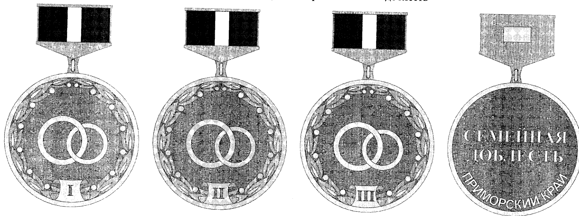
Рисунок почетного знака Приморского края "Семейная доблесть"