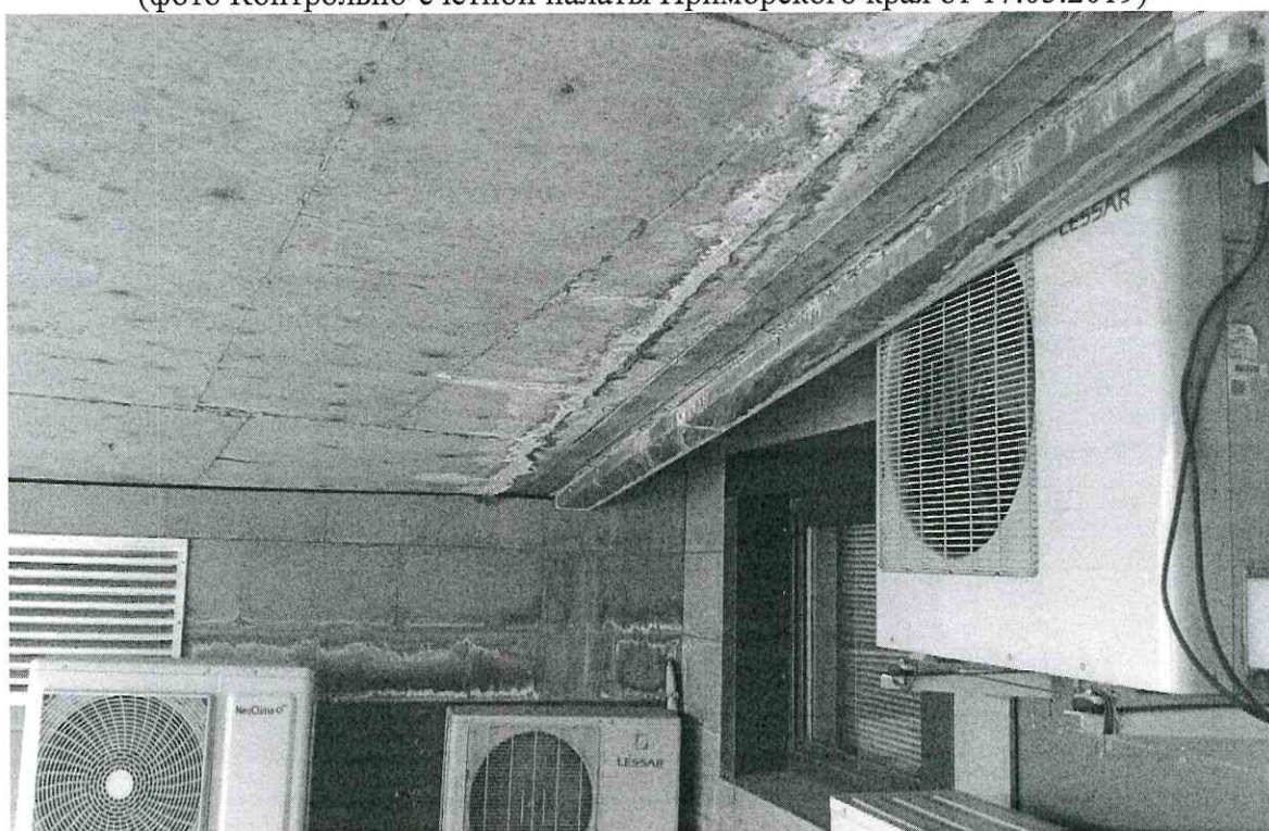
козырек перед помещением кассы, Восточная сторона КСК "Фетисов-Арены"

Определением Арбитражного суда Хабаровского края от 15.06.2015 в отношении ФГУП "ГУСС "Дальспецстрой" при Спецстрое России" 5 возбуждено производство по Делу № А73-8059/2015 о признании его несостоятельным (банкротом), определением от 02.03.2018 в отношении предприятия (ФГУП "ГВСУ № 6") введено внешнее управление сроком на 18 месяцев.